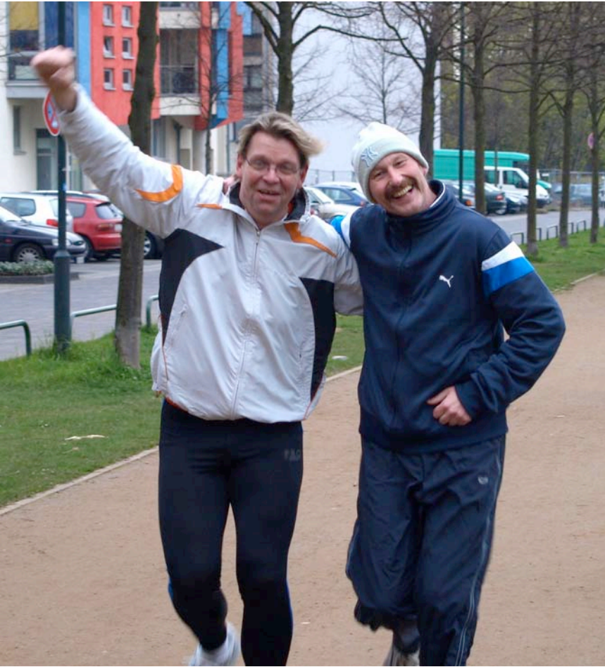
„Letzte Runde, geschafft“